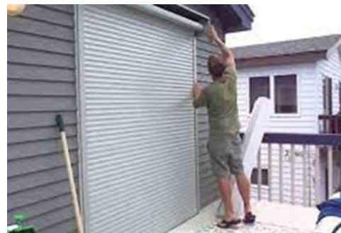
Imagen 3: Protección contra huracán

En la actualidad los procesos constructivos han evolucionado de tal manera que existen protecciones contra huracanes que cubren los vanos de las edificaciones, es necesario considerar que los edificios de gran altura cuenten con de manera obligatoria con vidrios templados doble (imagen 2) en todas sus ventanas y con protección contra huracanes (Imagen 3) para evitar los daños producidos por los vientos de huracanes.