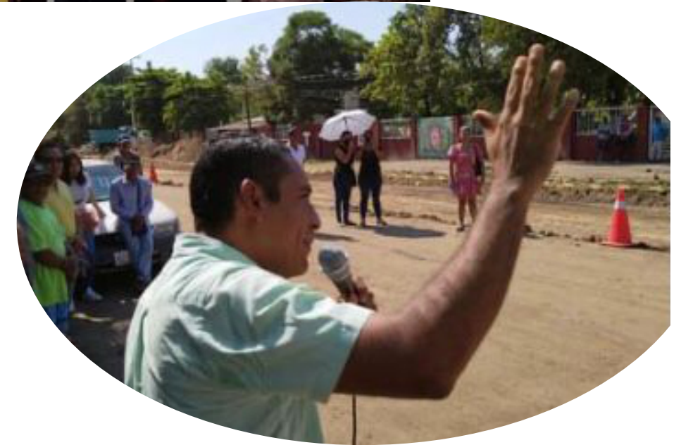
Dip. Ociel Hugar García Trujillo. Segundo Informe Legislativo