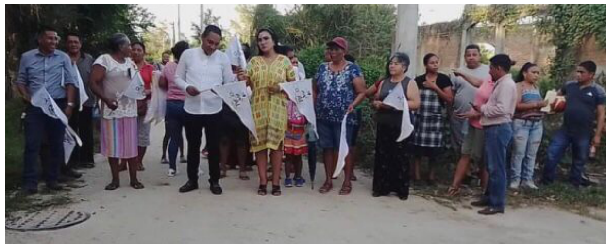
Dip. Ociel Hugar García Trujillo. Segundo Informe Legislativo