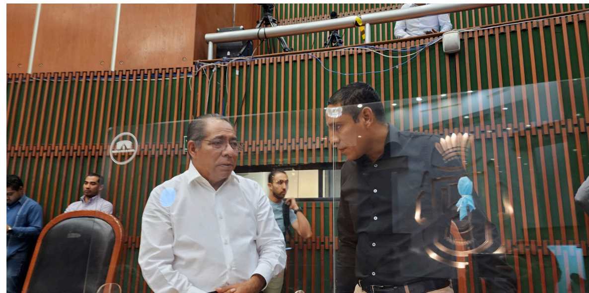
Dip. Ociel Hugar García Trujillo. Segundo Informe Legislativo

La Evaluación antes indicada específica a través del Árbol del problema del Programa de