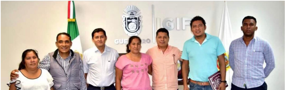
Dip. Ociel Hugar García Trujillo. Segundo Informe Legislativo