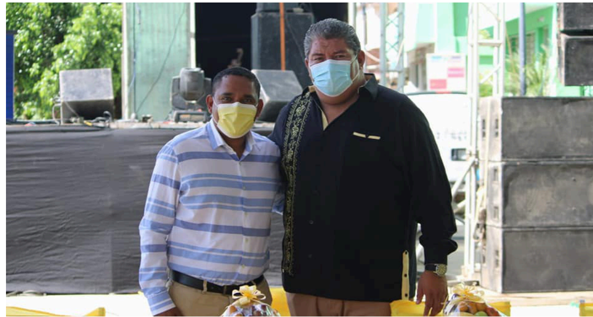
Dip. Ociel Hugar García Trujillo. Primer Informe Legislativo