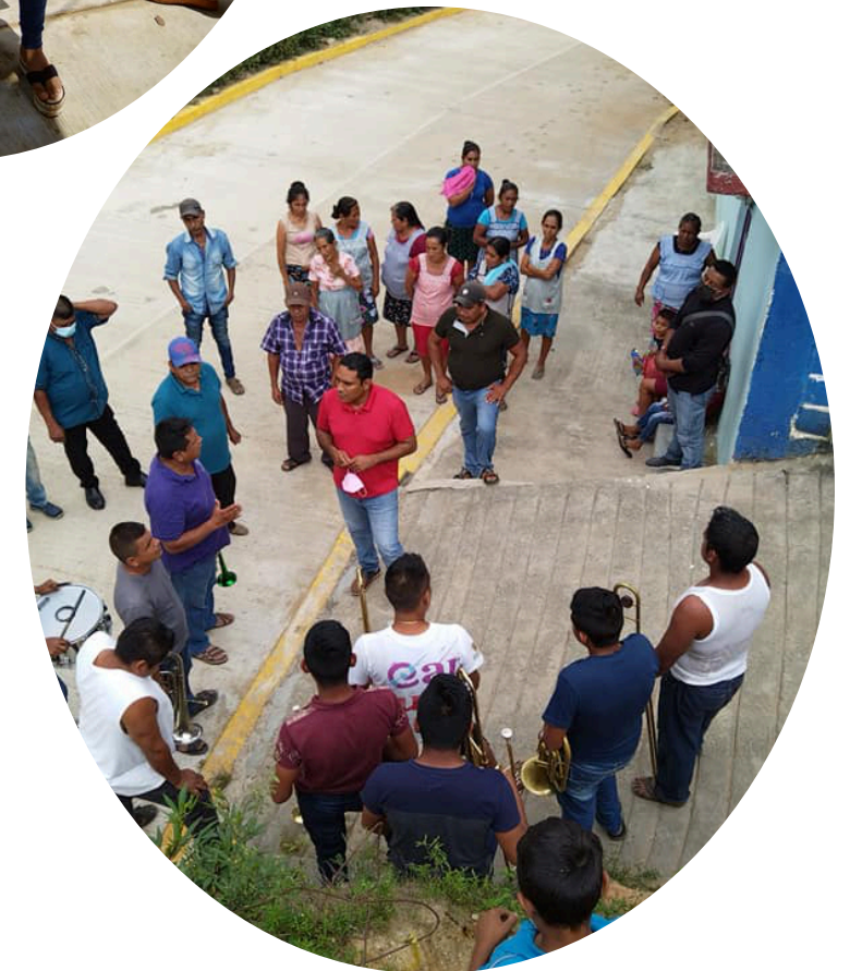
Dip. Ociel Hugar García Trujillo. Primer Informe Legislativo