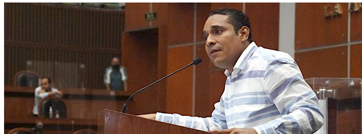
Dip. Ociel Hugar García Trujillo. Primer Informe Legislativo

PRIMERO.- La Sexagésima Tercera Legislatura al H. Congreso del Estado de Guerrero, en pleno respeto a la división de Poderes, exhorta a los municipios de: Acapulco de Juárez; Chilpancingo; Taxco de Alarcón; Leonardo Bravo; Atoyac de Álvarez; Ometepec; Cuajinicuilapa; Ayutla de los Libres; Arcelia; Técpan de Galeana; Copala; Tecoaapa; Martir de. Cuilapan, Huamuxtitlán; así como a las Entidades Municipales: CAPAMA, Sistema Municipal Dif Acapulco, para que de manera inmediata establezcan las acciones financieras que les permita realizar el pago al Instituto de Seguridad Social de los Servidores Públicos del Estado de Guerrero, y así se garantice el derecho humano a la seguridad social de los trabajadores.