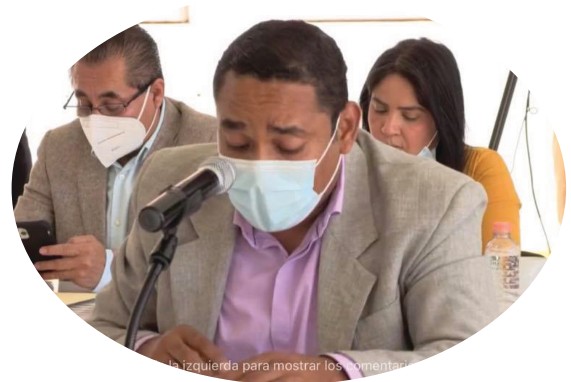
Dip. Ociel Hugar García Trujillo. Primer Informe Legislativo