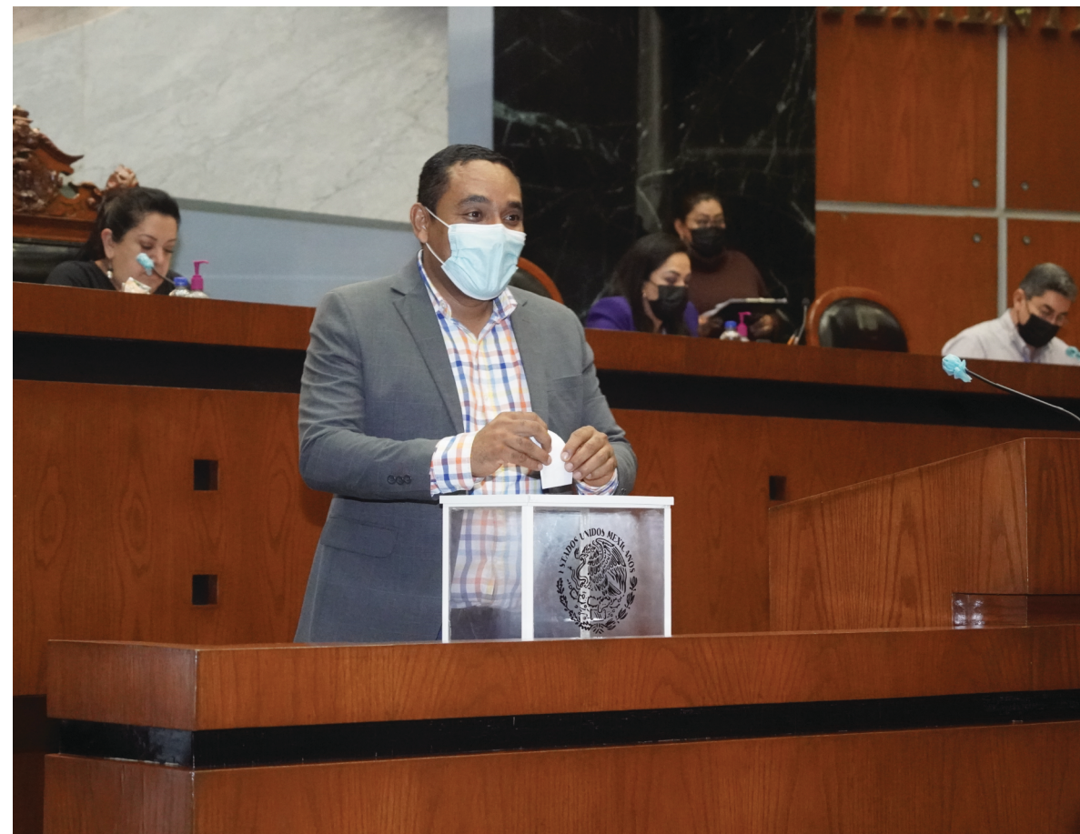
Dip. Ociel Hugar García Trujillo. Primer Informe Legislativo

PRIMERO. El Pleno de la Sexagésima Tercera Legislatura al Honorable Congreso del Estado, instruye a la Junta de Coordinación Política, para que de manera inmediata convoque al Poder Ejecutivo, a través de la Secretaría General de Gobierno, para que de manera conjunta establezcan la Mesa Técnica Interinstitucional que será la responsable de la realización de las etapas de la Consulta a los Pueblos y comunidades Indígenas, y pueblos Afromexicanos, en cumplimiento a la Acción de Inconstitucionalidad 81/2018, resuelta por el Pleno de la Suprema Corte de Justicia de la Nación.