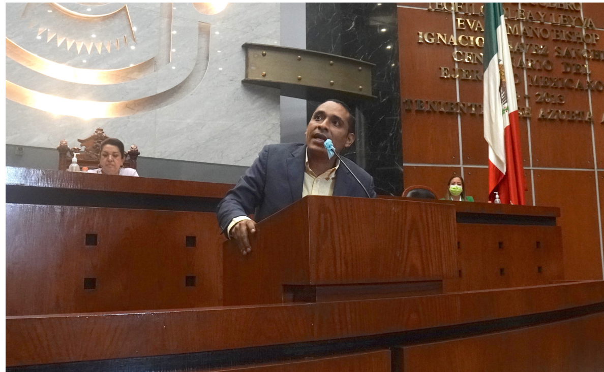
Dip. Ociel Hugar García Trujillo. Primer Informe Legislativo

La reserva de artículos en lo particular de un dictamen o Acuerdo Parlamentario, se aprobará por mayoría simple, siempre que en lo general se haya aprobado por mayoría absoluta de los Diputados presentes, a excepción de cuando la Constitución, esta Ley u otro ordenamiento aplicable determinen una votación por mayoría calificada.