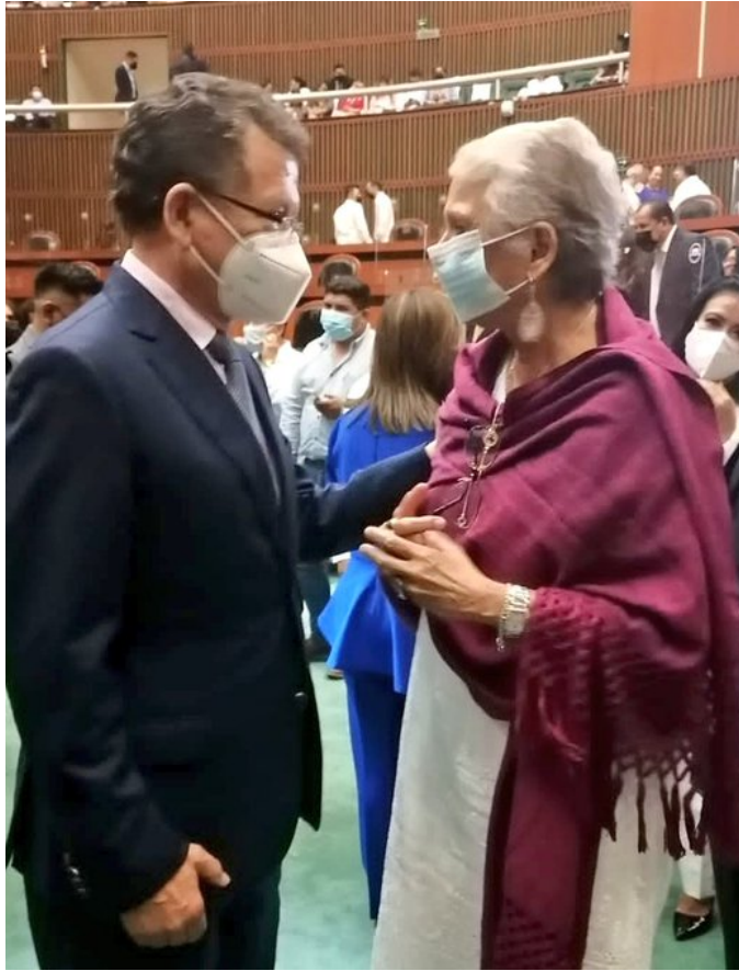
Senadora Olga Sánchez Cordero