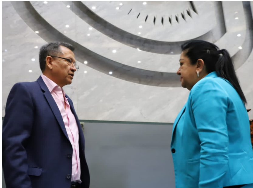
Sesión de 31 de mayo.

Mi participación en las sesiones que se realizaron en el salón de plenos fue permanente, cumpliendo en todo momento con la la legalidad y promoviendo el diálogo junto con las y los integrantes del Grupo Parlamentario del PRI, con los demás grupos y representaciones parlamentarias, para construir los acuerdos necesarios para avanzar en los temas de la agenda legislativa.