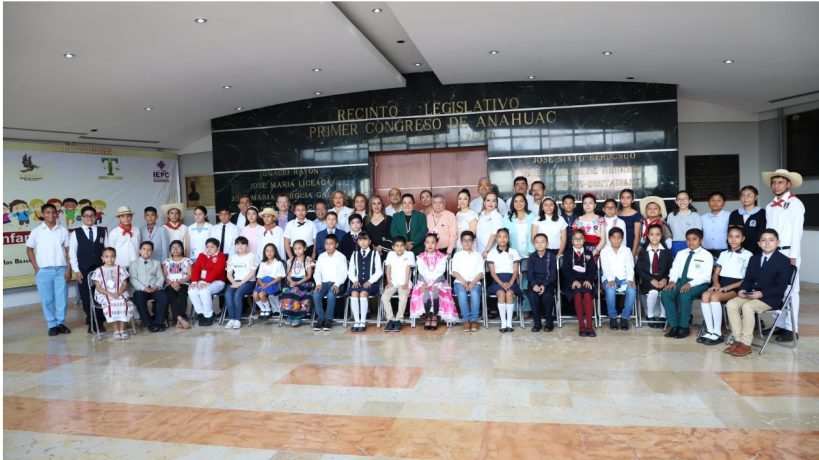
25 de mayo. XIV Parlamento Infantil 2022