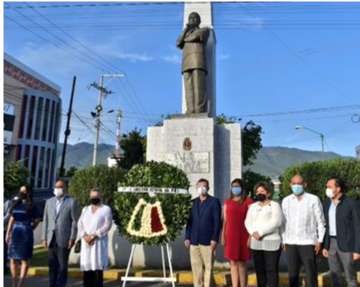
28 de septiembre.- Aniversario luctuoso de José Francisco Ruiz Massieu.