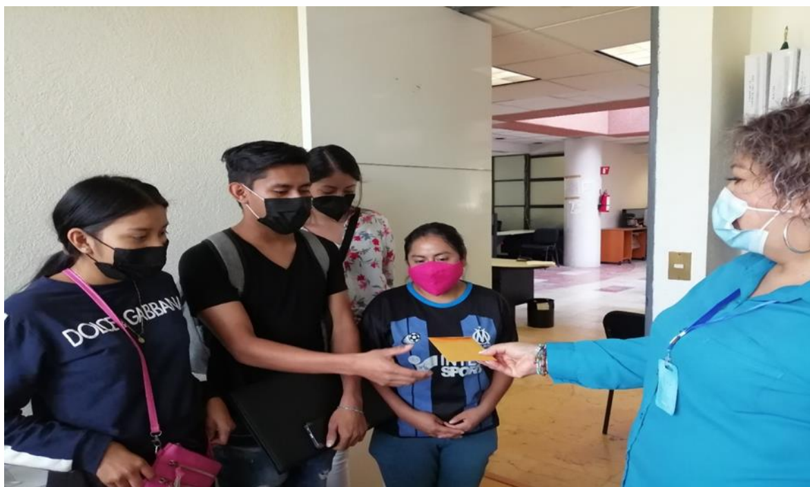
Apoyo económico a estudiantes.

Apoyo económico a los estudiantes de la Alta Montaña de la Casa de Estudiante “Primer Congreso de Anáhuac”, la Universidad Autónoma de Guerrero.