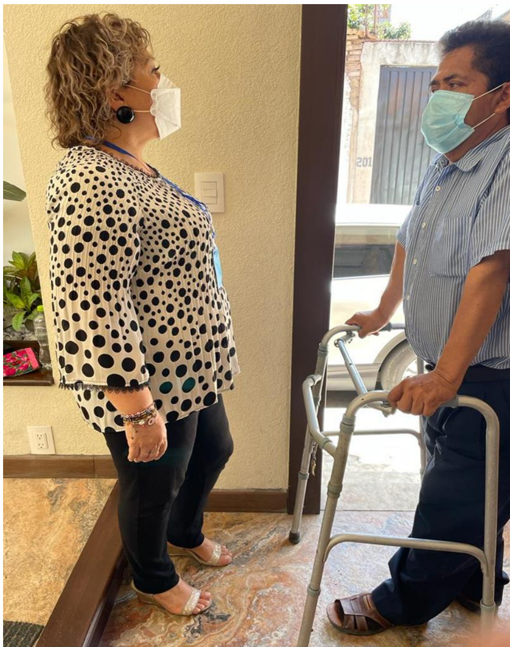
Apoyo con un aparato médico a un ciudadano de Chilapa de Álvarez, Guerrero.