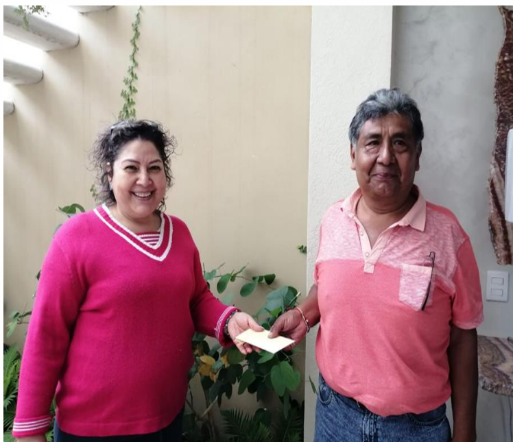
Apoyo de alimentos de la canasta básica a personas de escasos recursos, de Colonias de Chilapa de Álvarez, Guerrero.