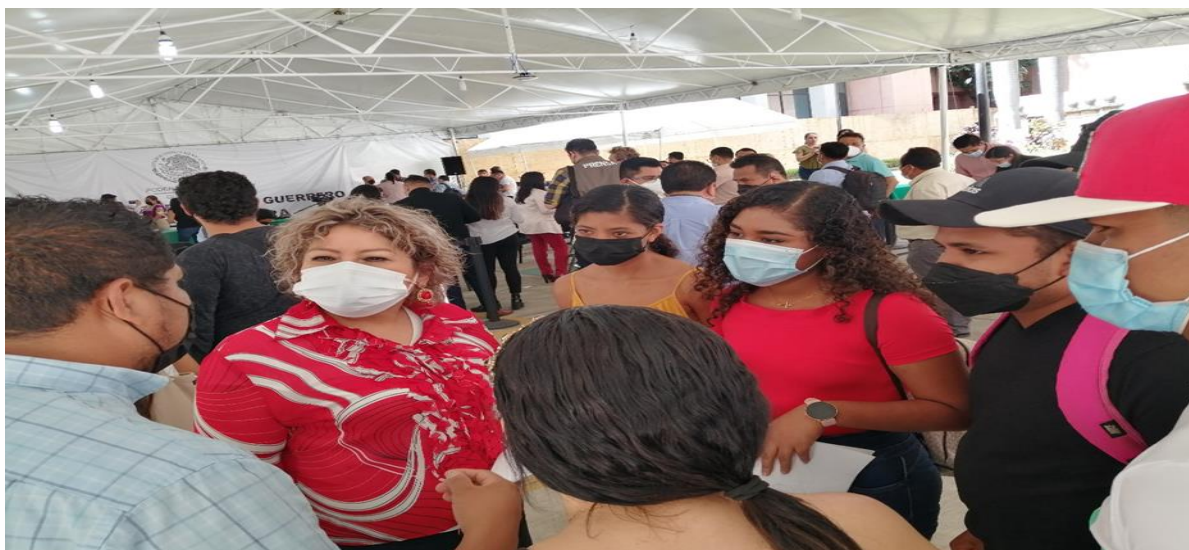
Atención a los estudiantes de la Facultad de Ingeniería de la Universidad Autónoma de Guerrero.