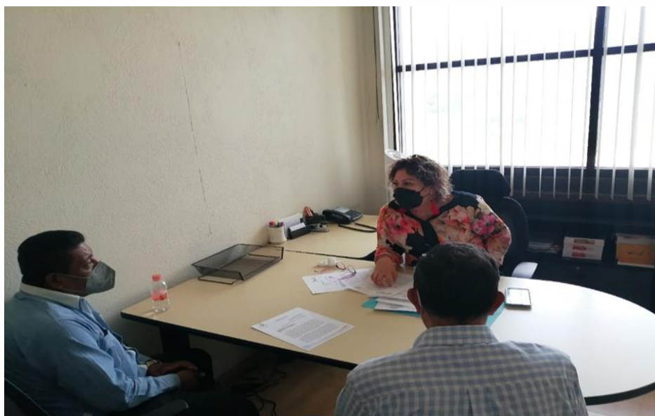
Atención al Ciudadano Presidente Municipal de del Honorable Ayuntamiento de Atlixnac, Guerrero.