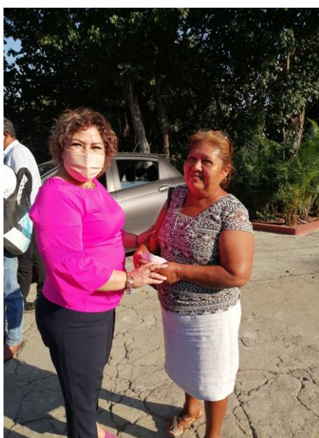
Apoyo económico a personas de la tercera edad de bajos recursos, de Chilapa de Álvarez Guerrero