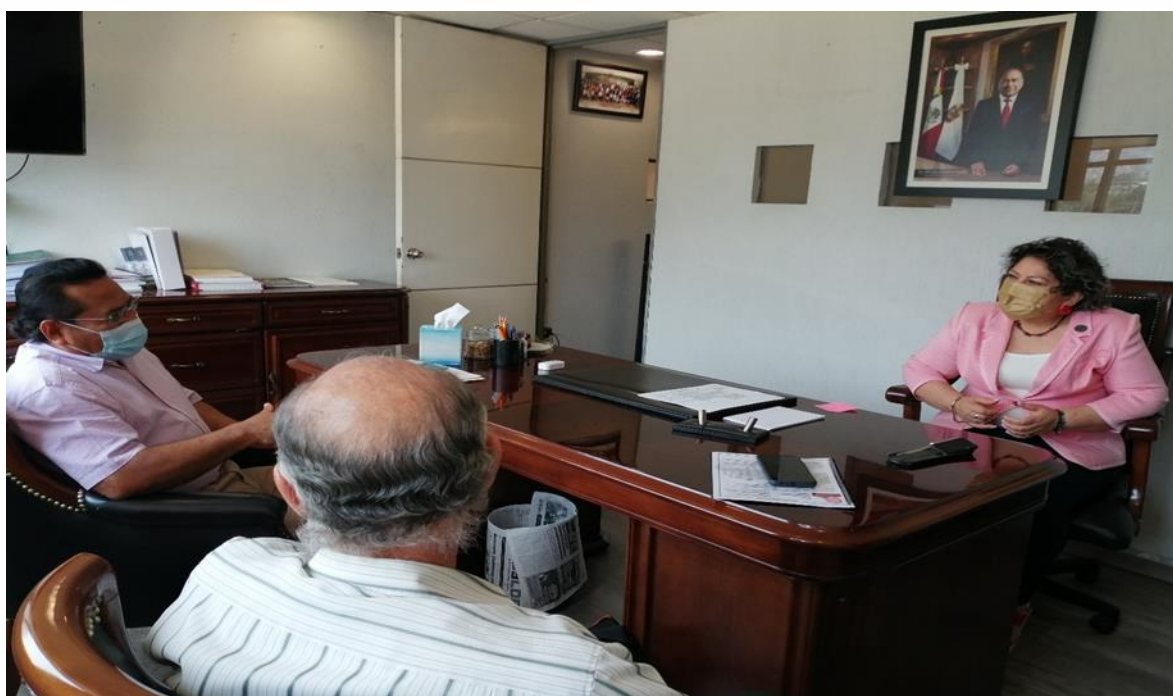
Atención de Ciudadanos del Nuevo Municipio de Las Vigas, Guerrero.