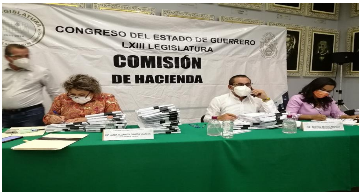
COMISIONES UNIDAS DE JUSTICIA Y DE PRESUESTO Y CUENTA PÚBLICA