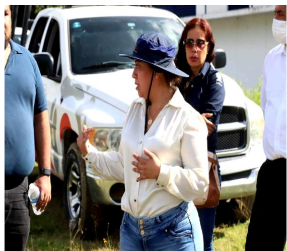
Gráficas: Recorrido de supervisión en el cárcamo sur y en el resumidero de la Presa ubicada en el Municipio de Tixtla de Guerrero.