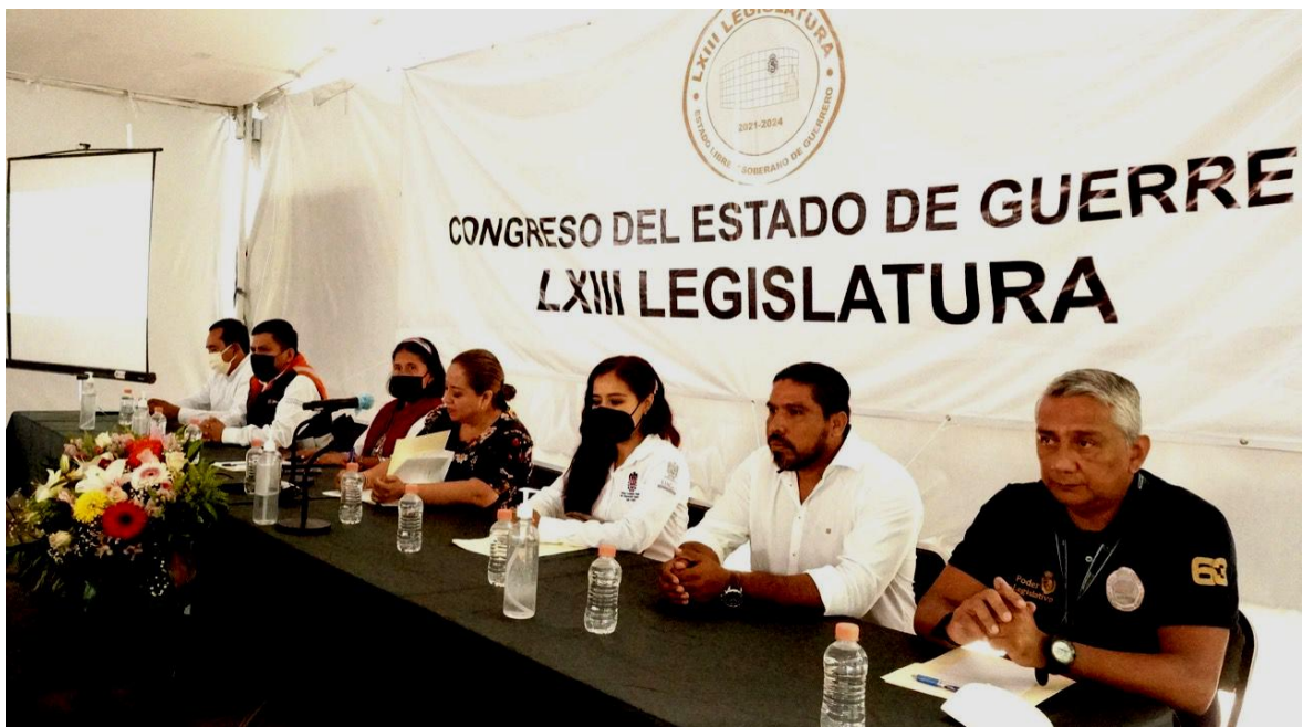
Gráfica: Desarrollo de la Capacitación "Plan Familiar de Protección Civil".