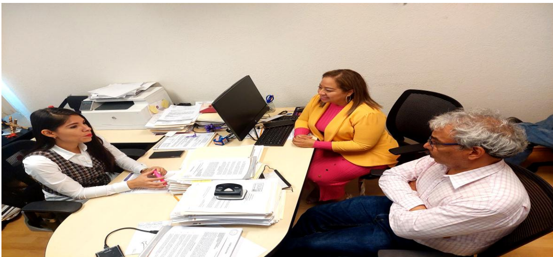
Gráfica: Reunión de Trabajo.

En este sentido se generaron las condiciones para establecer una reunión de trabajo entre el titular de la Secretaría de Gestión Integral de Riesgo y Protección Civil del Gobierno del Estado de Guerrero y la Comisión de Presupuesto y Cuenta Pública.