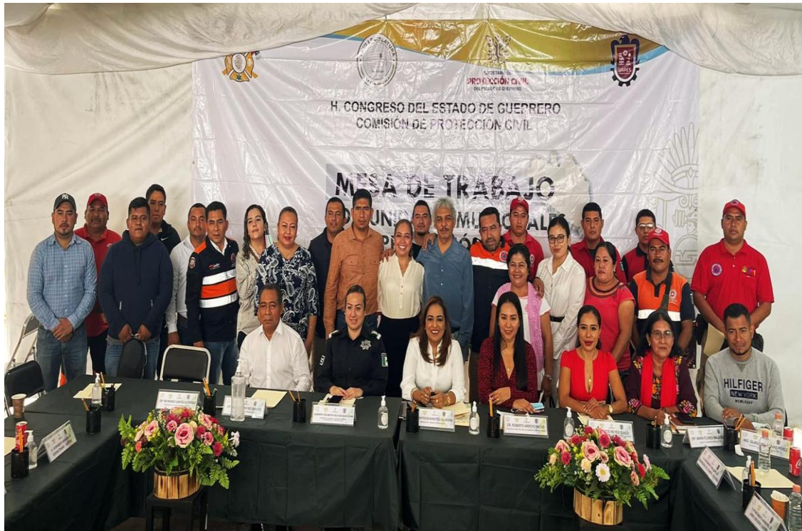
Gráfica: Mesa de Trabajo Realizada en la Región Centro.