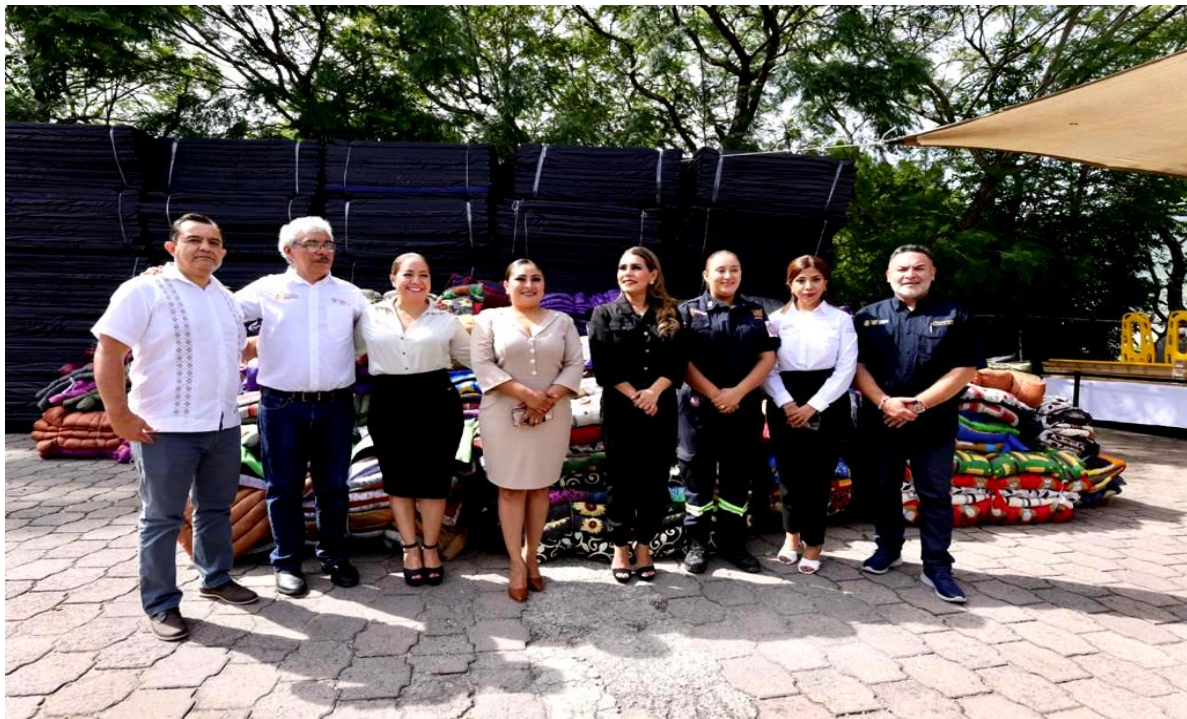
Gráfica: Entrega de equipo y material a la Secretaría de Protección Civil Estatal.