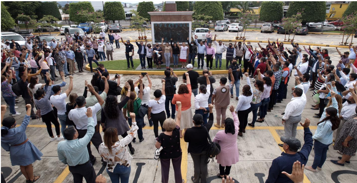
Gráficas: Desarrollo del "Simulacro Nacional 2022".