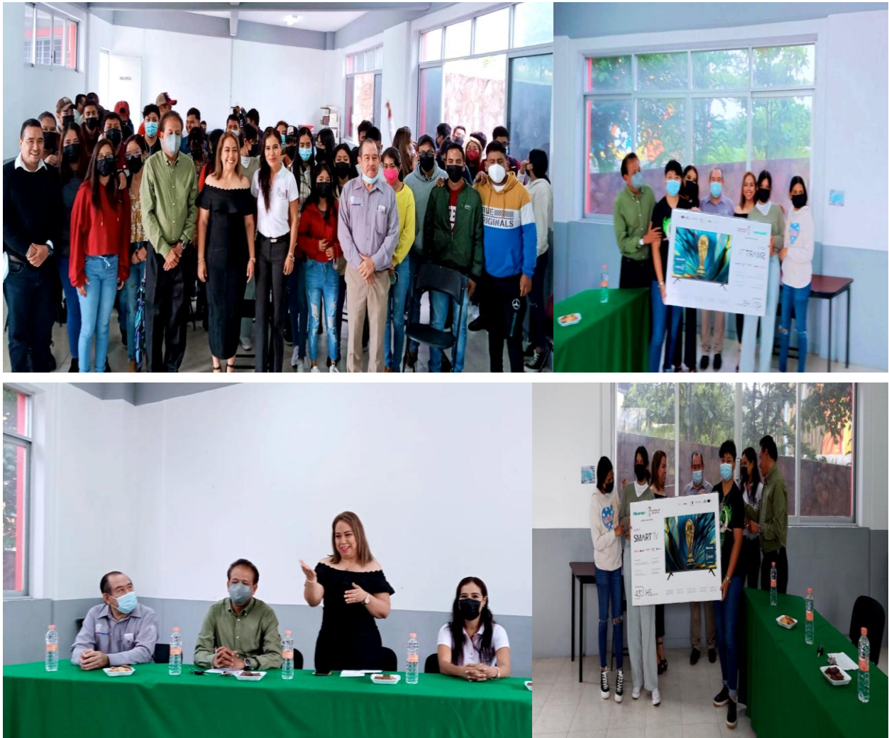
Gráficas: Apoyo al Centro de Monitoreo de la Carrera de Ingeniería en Prevención de Desastres y Protección Civil.