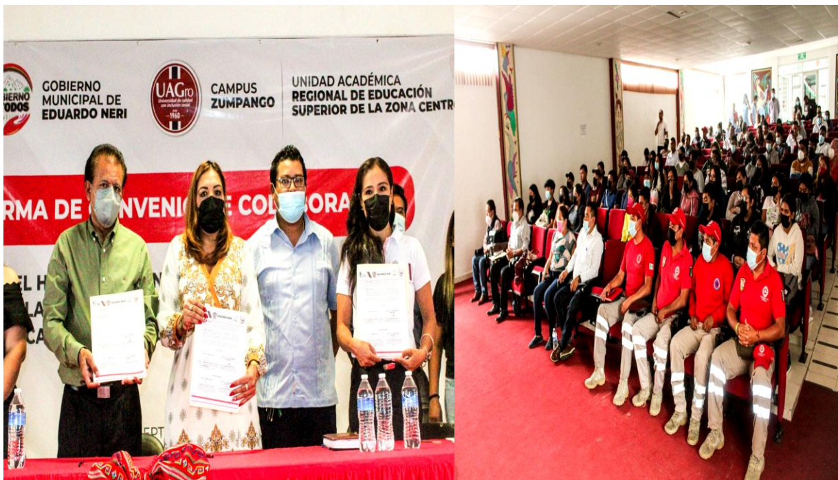
Gráficas: Firma del Convenio de Colaboración.