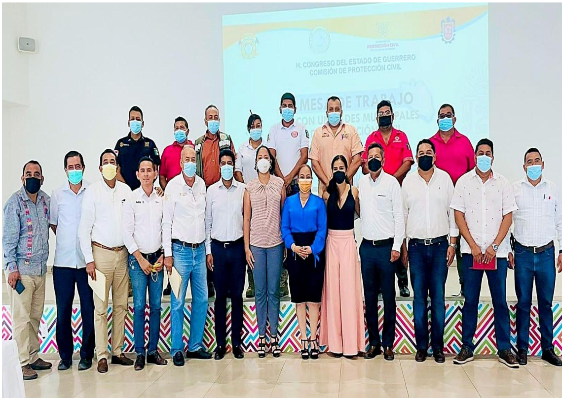
Gráfica: Mesa de Trabajo Realizada en la Región Costa Grande.