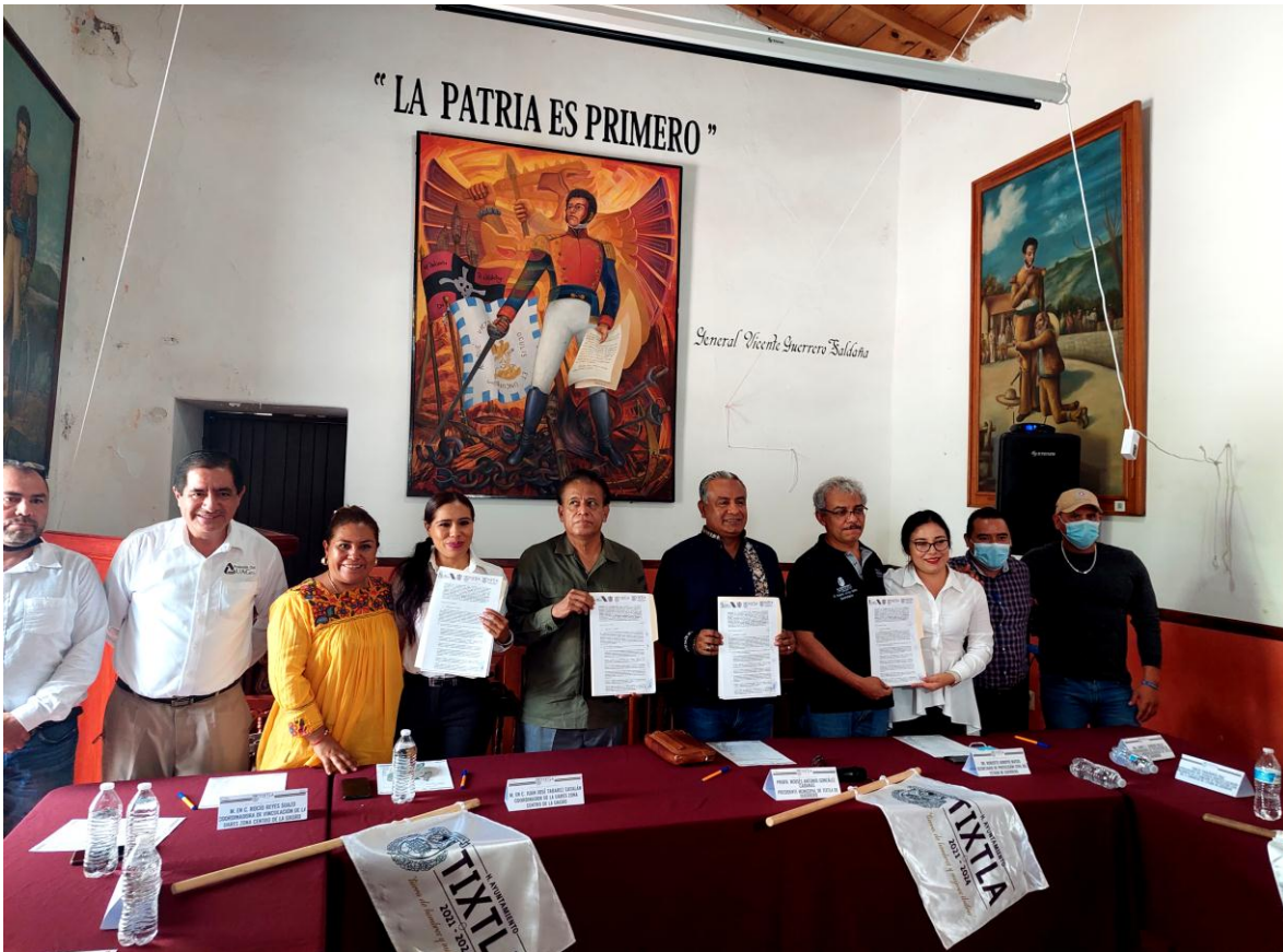
Gráficas: Firma del Convenio de Colaboración.