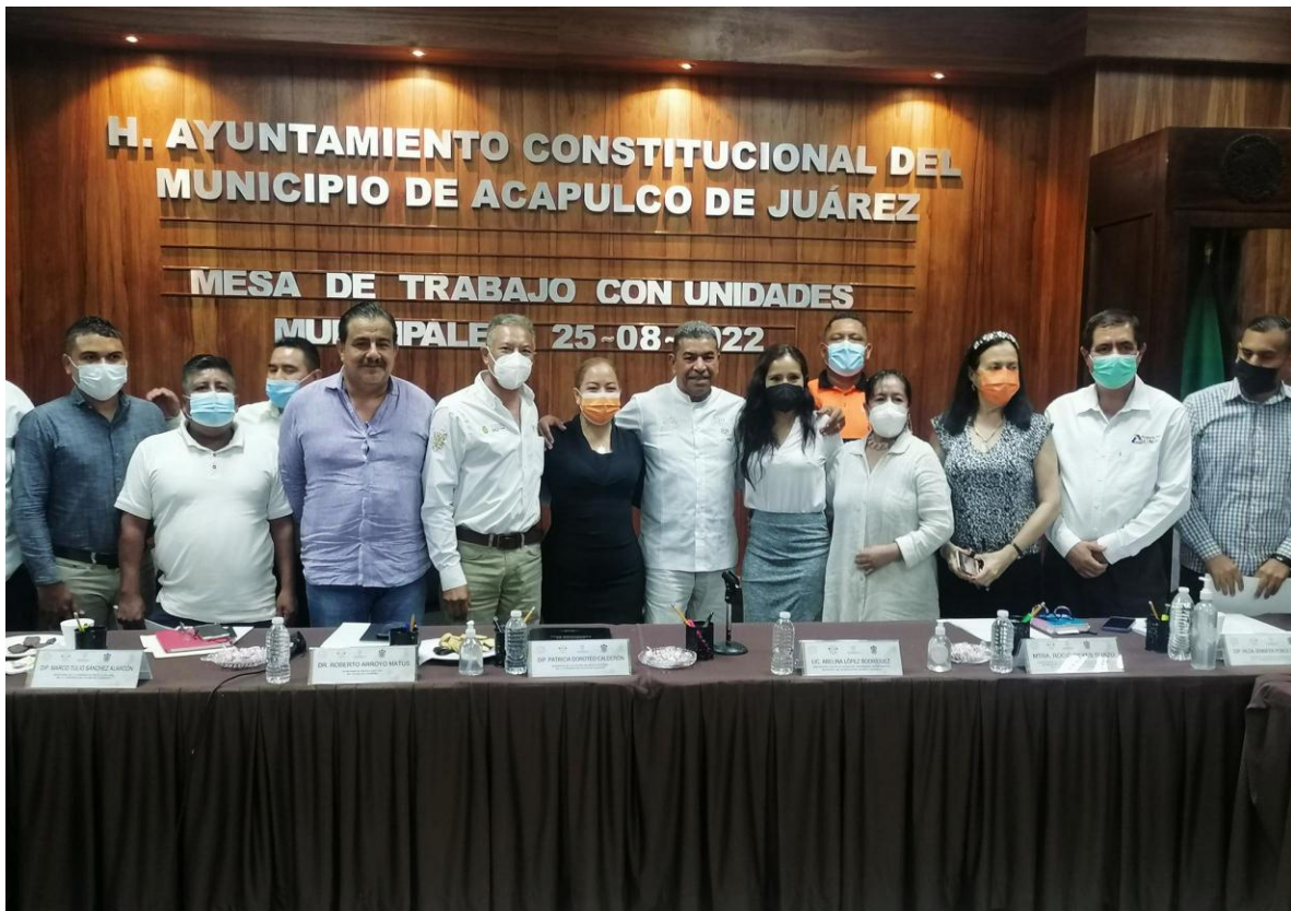
Gráfica: Mesa de Trabajo Realizada en la Región Acapulco además de los Municipios de Ayutla, Tecoanapa, Coyuca de Benítez, Florencio Villarreal y San Marcos.