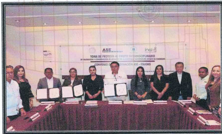
Firma de renovación del Convenio de Colaboración entre la ASE y el ITAIGro. 28 de septiembre de 2022.