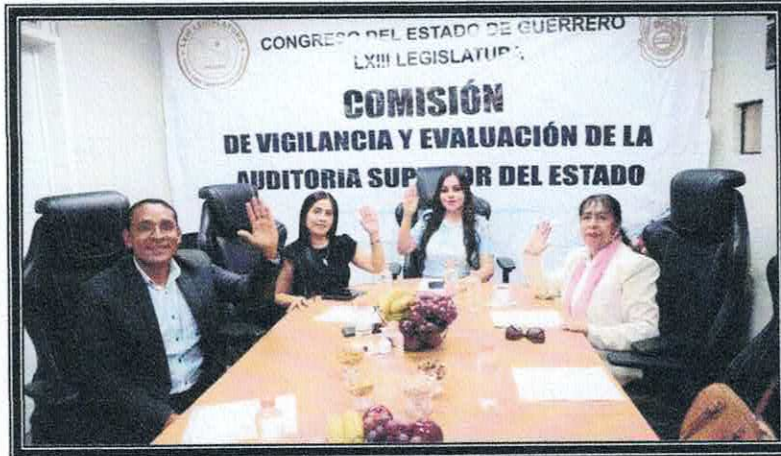
Quinta Sesión Extraordinaria de la Comisión. 12 de septiembre de 2022.