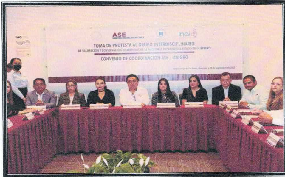
Instalación y toma de protesta del Grupo Interdisciplinario de Valoración y Conservación de Archivos de la ASE. 28/09/2022.