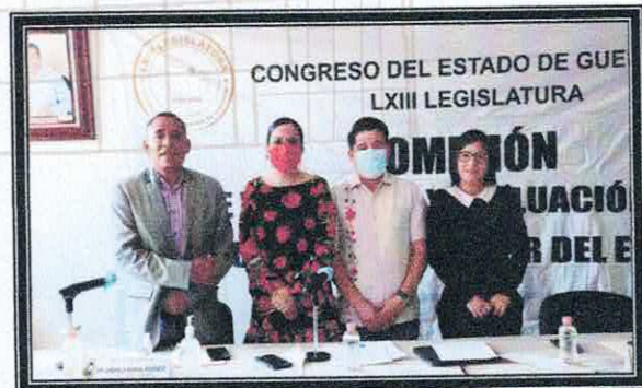
Novena Sesión Ordinaria de la Comisión. 23 de agosto de 2022.