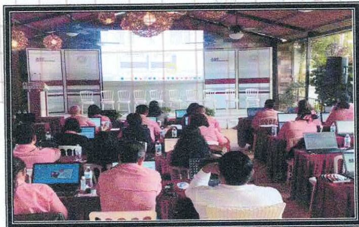
Clausura del curso "Uso de las herramientas Tecnológicas en los trabajos de fiscalización". 14 de octubre de 2022.