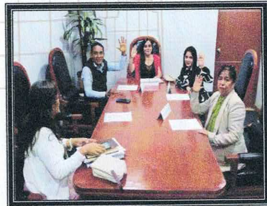
Décima Sesión Ordinaria de la Comisión. 29 de septiembre de 2022.