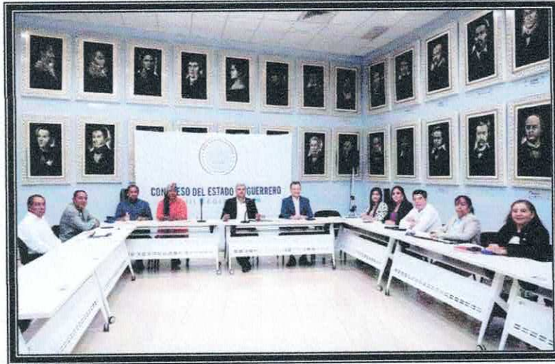
Reunión Junta de Coordinación Política y la Comisión. 01 de septiembre de 2022.