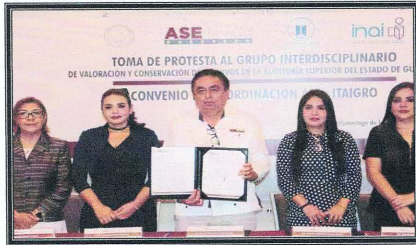
Firma de renovación del Convenio de Colaboración entre la ASE y el ITAIGro. 28 de septiembre de 2022.