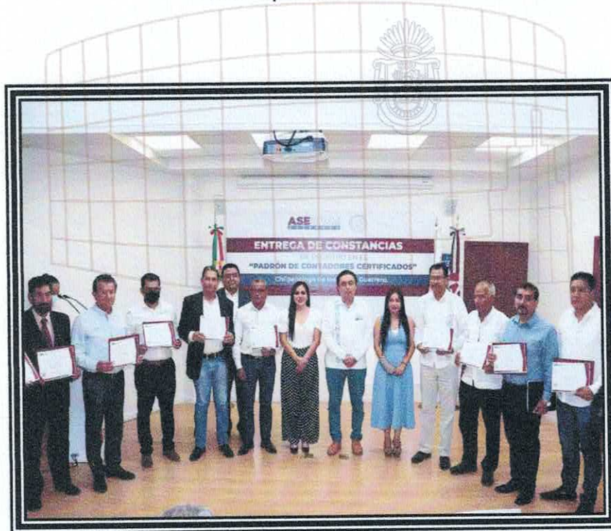
Entrega de constancias Padrón de Contadores Certificados. 22 de septiembre de 2022