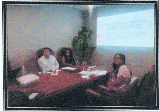
Análisis del Anteproyecto de Presupuesto de la ASE. 18 de agosto de 2022.