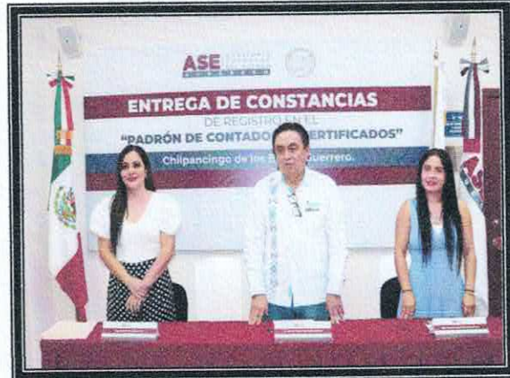
Entrega de constancias Padrón de Contadores Certificados. 22 de septiembre de 2022