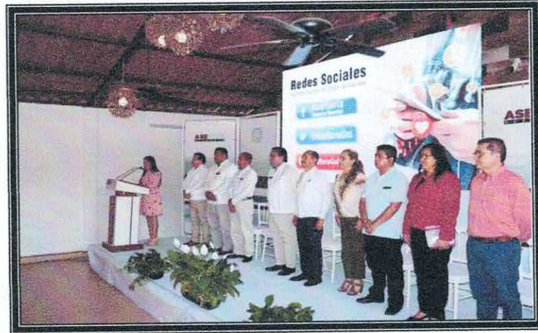
Inauguración curso "Uso de las herramientas Tecnológicas en los trabajos de fiscalización". 12 de octubre de 2022.