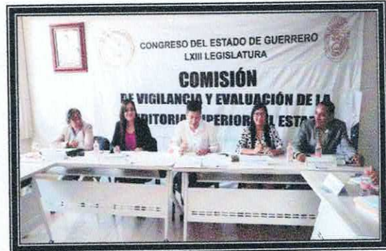
Cuarta Sesión Extraordinaria de la Comisión. 01 de septiembre de 2022.