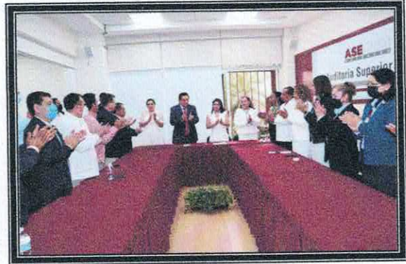
Presentación del Auditor Superior del Estado. 13 de septiembre de 2022.