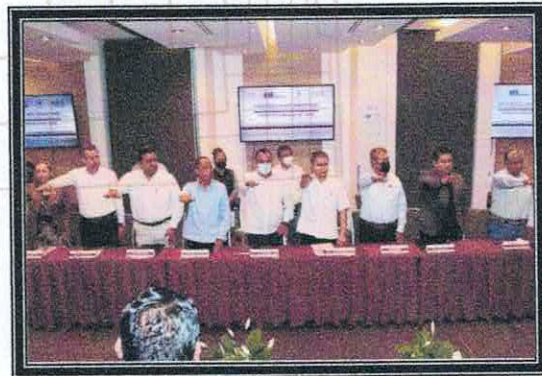
Instalación y toma de protesta del Grupo Interdisciplinario de Valoración y Conservación de Archivos de ASE. 28 de septiembre de 2022.