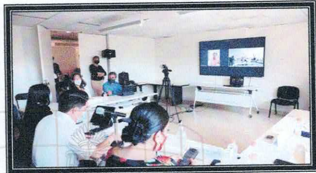
Novena Sesión Ordinaria de la Comisión. 23 de agosto de 2022.