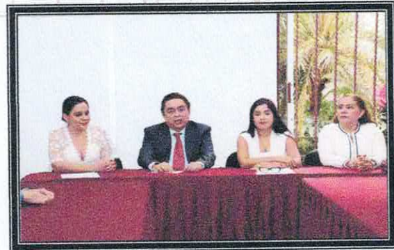
Presentación del Auditor Superior del Estado. 13 de septiembre de 2022.