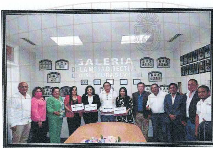
Recepción del proyecto de presupuesto de la ASE, para el ejercicio fiscal 2023, modificado.