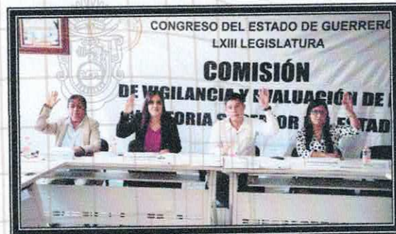
Cuarta Sesión Extraordinaria de la Comisión. 01 de septiembre de 2022.