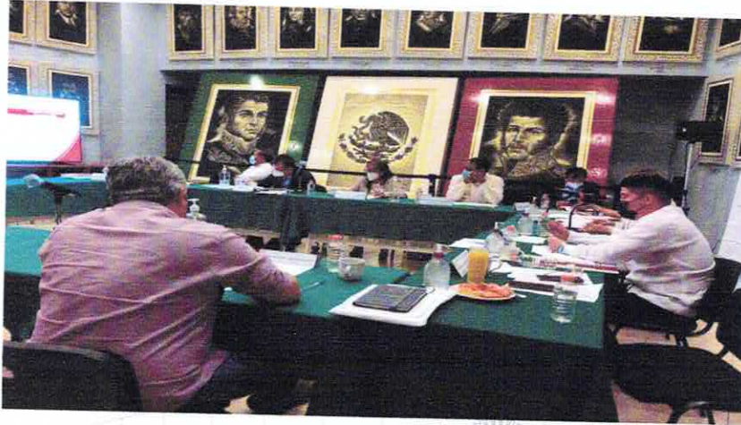
Reunión de trabajo Comisión-JUCOPO-ASE. 08 de febrero de 2022.