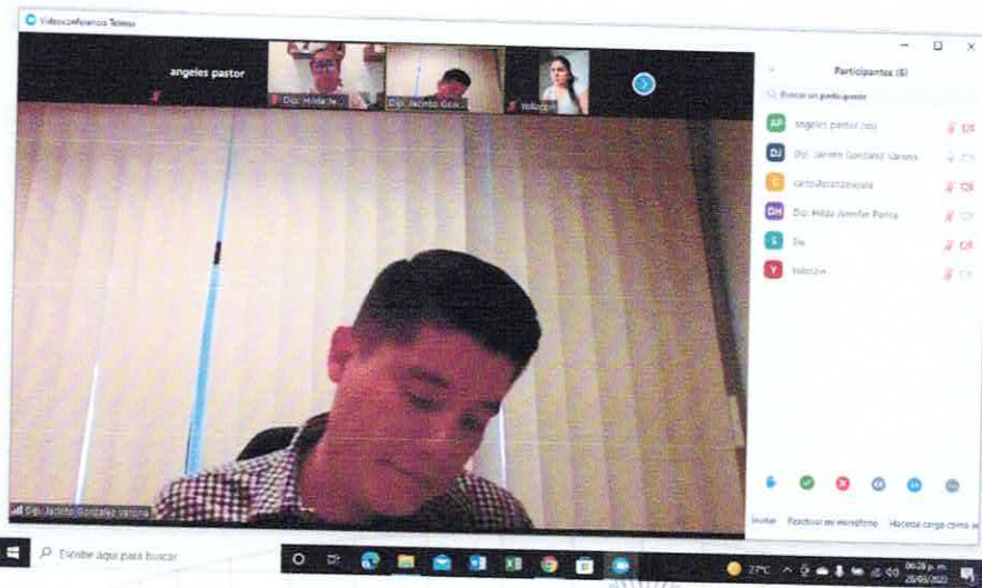
Sexta Sesión Ordinaria Virtual de la Comisión, 28 de marzo de 2022.