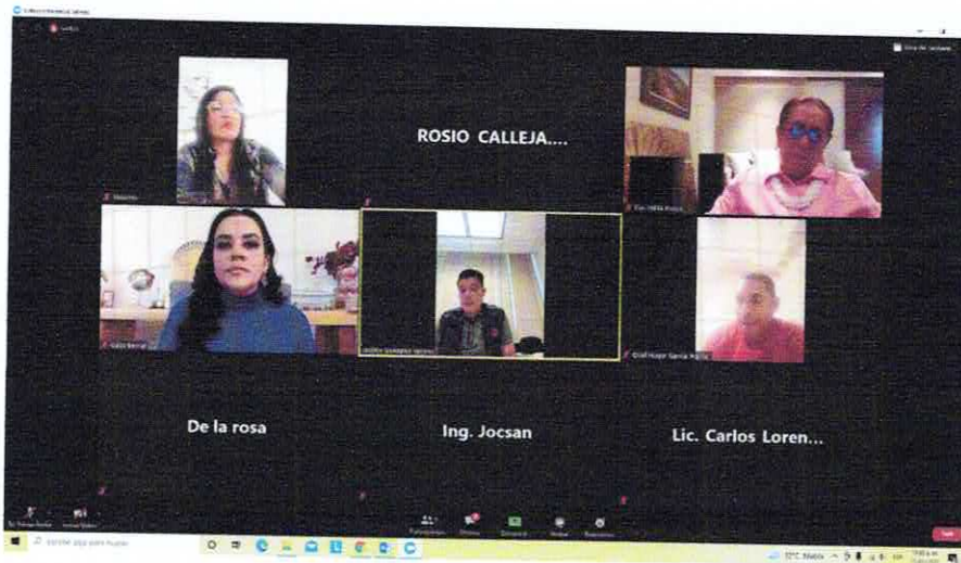
Cuarta Sesión Ordinaria Virtual de la Comisión, 31 de enero de 2022.