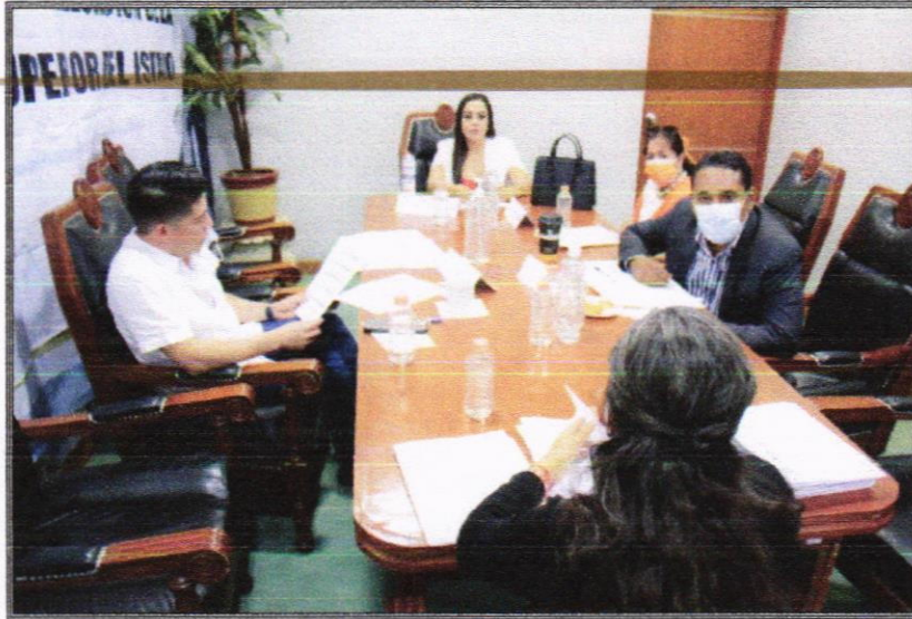
Reunión de trabajo.