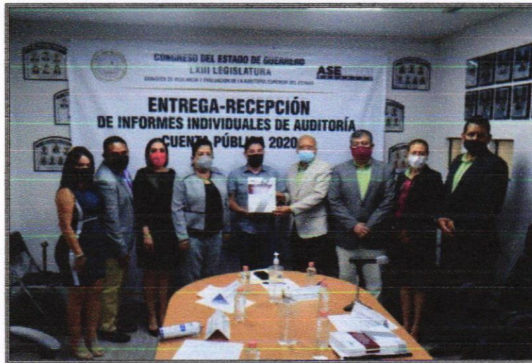
Entrega-recepción de Informes Individuales de Auditoría. 29 de octubre de 2021.