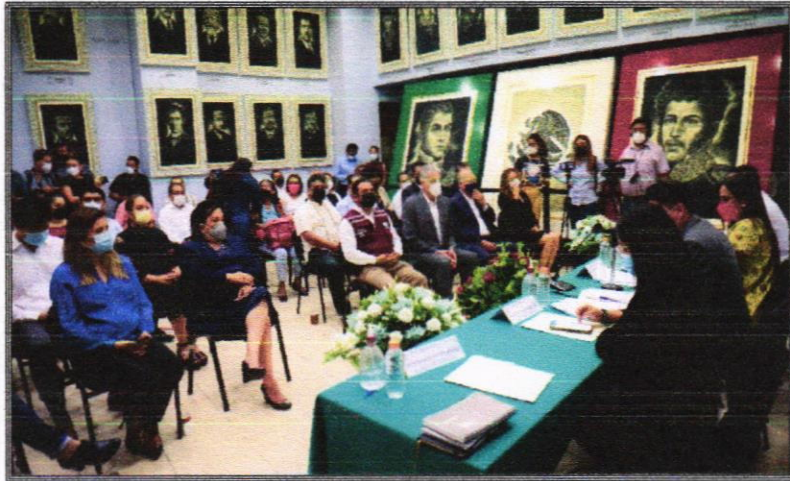
Primera Sesión de Instalación de la Comisión.