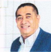
DIP. JESÚS PARRA GARCÍA