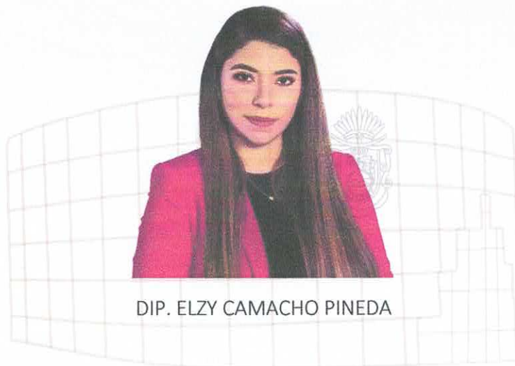
DIP. ELZY CAMACHO PINEDA

Con fecha 20 de octubre del 2021, el Pleno del Honorable Congreso del Estado aprobó por unanimidad el Acuerdo por el que se integran las Comisiones y Comités Ordinarios, quedando conformada la Comisión Ordinaria de Desarrollo Urbano y Obras Públicas de la siguiente manera: