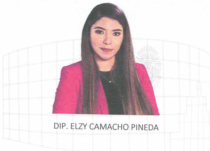
DIP. ELZY CAMACHO PINEDA

Con fecha 20 de octubre del 2021, el Pleno del Honorable Congreso del Estado aprobó por unanimidad el Acuerdo por el que se integran las Comisiones y Comités Ordinarios, quedando conformada la Comisión Ordinaria de Desarrollo Urbano y Obras Públicas de la siguiente manera: