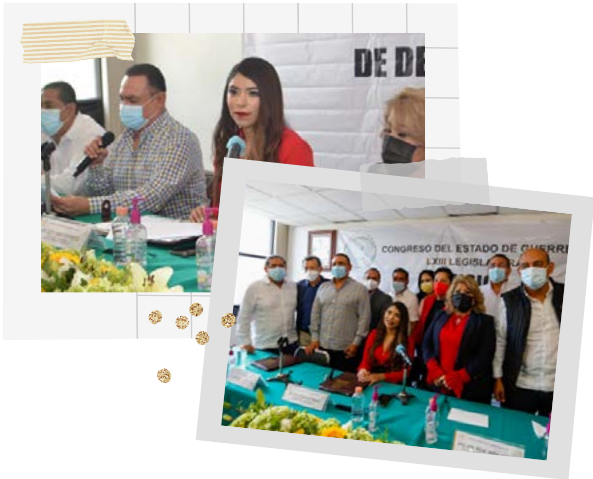
Sesión de Instalación de la Comisión de Desarrollo Urbano y Obras Públicas