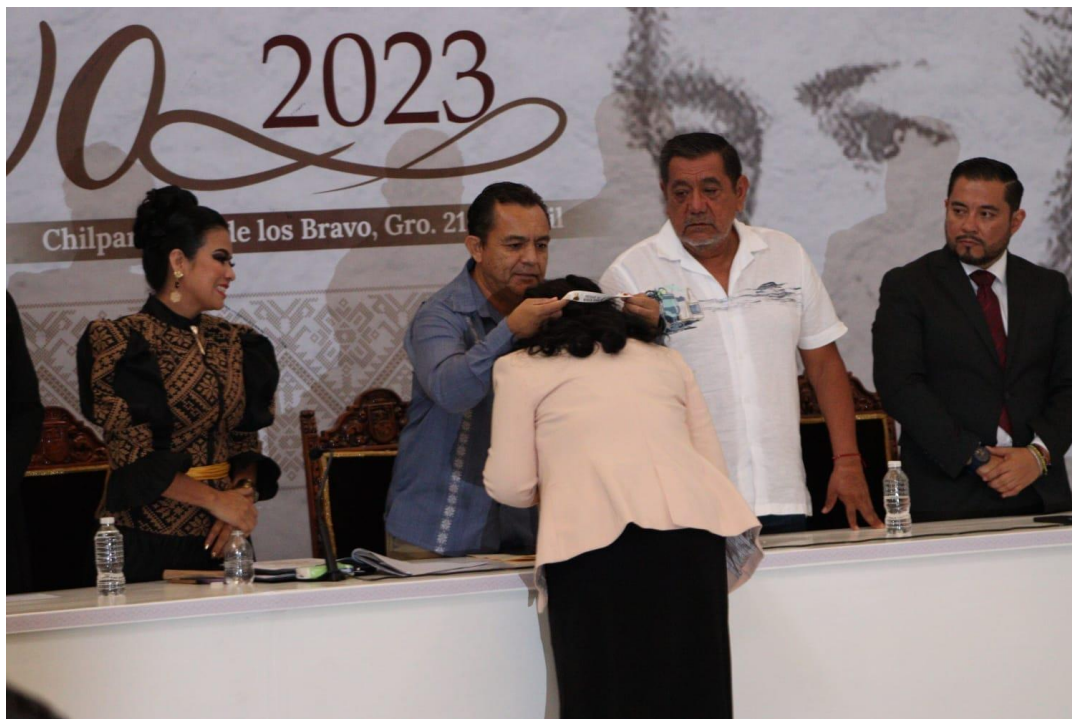
En la entrega de preseas al mérito civil "Hermanos Bravo 2023".