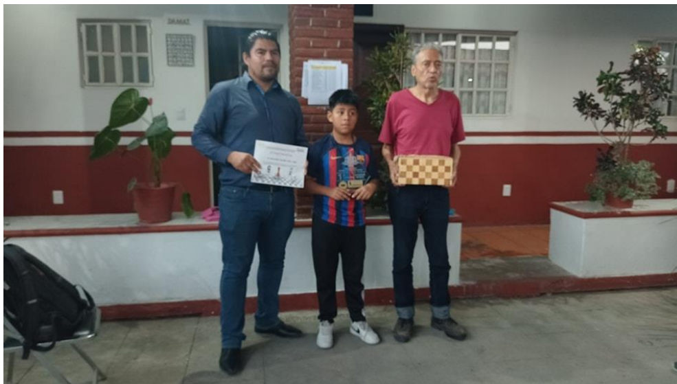
Apoyando en torneos de ajedrez.