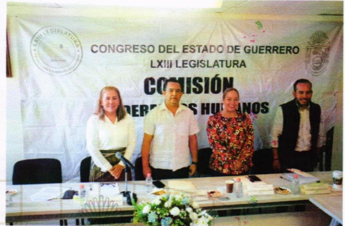
Aspectos de la 4ª Sesión Ordinaria de la Comisión de Derechos Humanos.