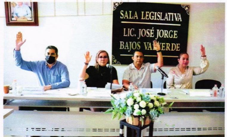
Aspectos de la 5ª Sesión Ordinaria de la Comisión de Derechos Humanos.