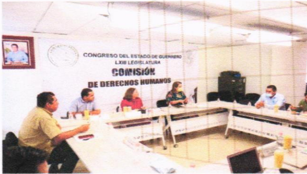
Aspecto de la 7ª SE de la CDDHH de fecha 24 de junio de 2022.