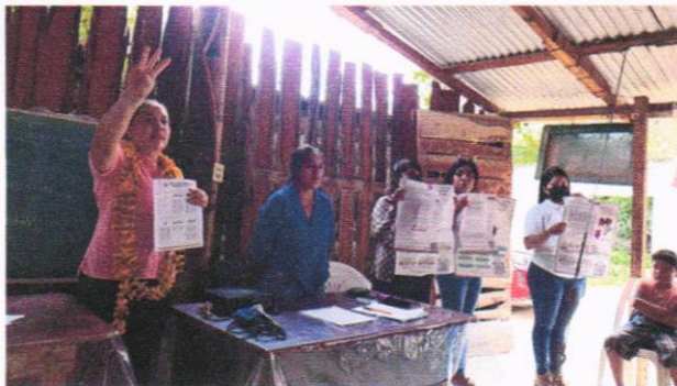
Entrega de invitaciones al Proceso de consulta en materia electoral, en el municipio de Tlapa de Comonfort.