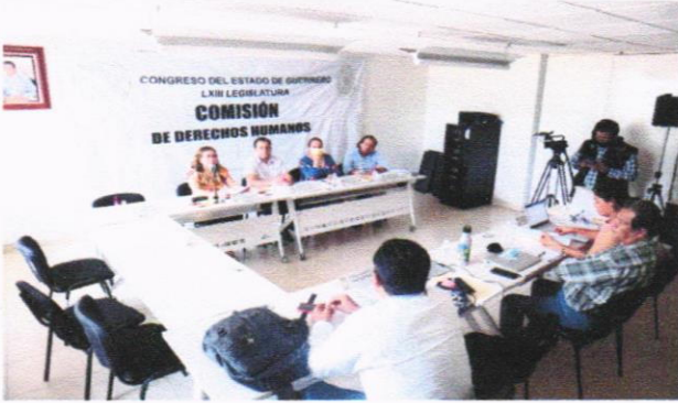
Aspecto de la 6ª SO de la CDDHH. Mayo 24 de 2022.