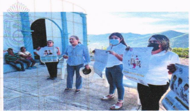
Aspecto de la entrega de invitaciones del Proceso de Consulta en materia electoral, en Tlapa de Comonfort.