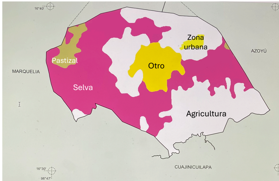
Mapa 3 Usi del suelo en el municipio de Juchitán, Guerrero