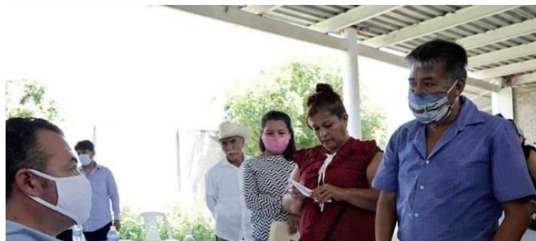
Reunión de trabajo con habitantes de la Comunidad de El Camarón, en la sierra de Atoyac de Álvarez.