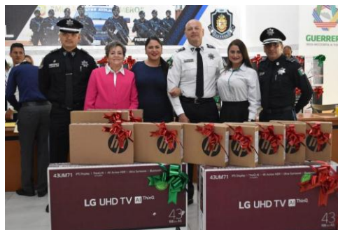
Entrega de reconocimientos a mujeres y hombres de la Policía Estatal en Chilpancingo