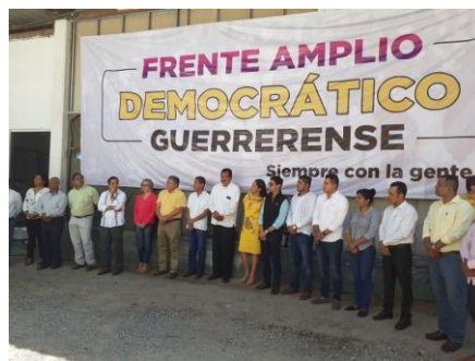
Inauguración de la Casa de Gestión del FADG en Chilpancingo, Gro.