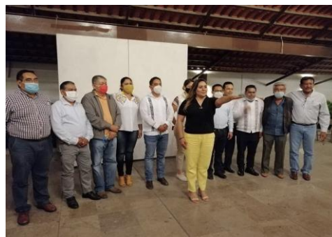
Elección de la nueva Dirigencia Estatal del Partido de la Revolución Democrática.