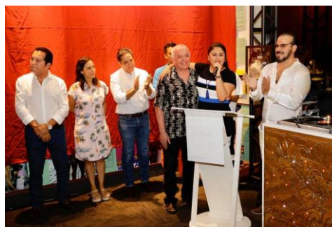
Develación de la exposición fotográfica e histórica del Acapulco de los 70s y 80s.