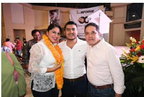
Primer Informe del Regidor de Chilpancingo, Gro., Óscar Garibay.