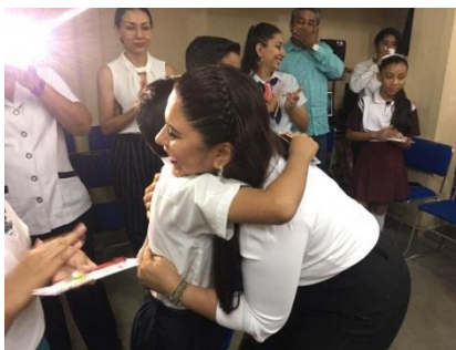
Entrega de material educativo al 18° Cabildo Infantil 2020-2021 de la zona escolar 57 de Educación Primaria de la ciudad de Acapulco