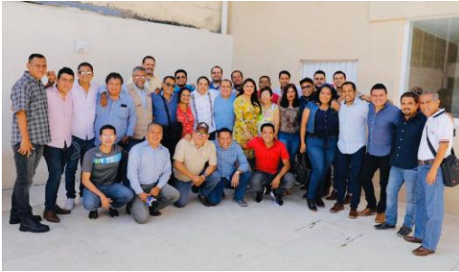
Encuentro con periodistas de Acapulco.