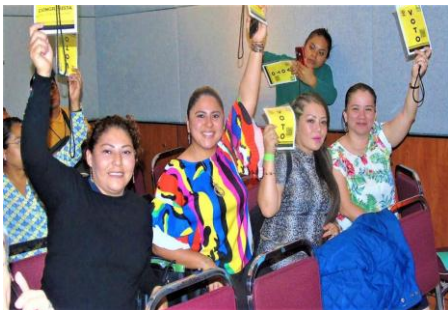
Congresista en el XVI Congreso Nacional Extraordinario del PRD.