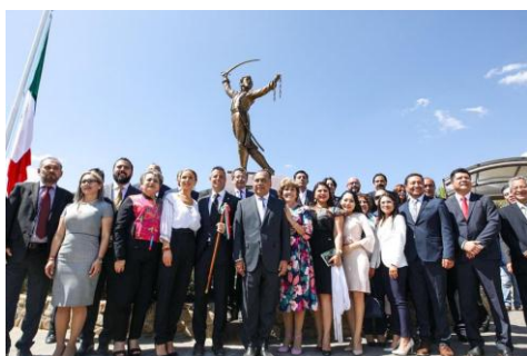
Homenaje al Gral. Vicente Guerrero Saldaña en Culiápam de Guerrero, Oaxaca.