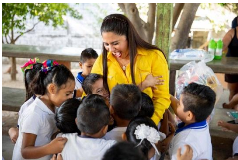
Entrega de material deportivo, de limpieza y una computadora para uso de la escuela Aquiles Serdán.