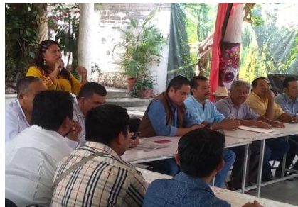
Reunión del FADG en la Región de la Montaña de Guerrero..