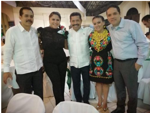
Quinta Noche Mexicana Rotaria del Club Rotario de Chilpancingo. Donde se recaudaron fondos para adquirir aparatos funcionales que fueron destinados a personas de escasos recursos.