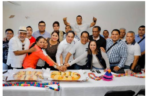
Desayuno con periodistas de Chilpancingo, Gro.