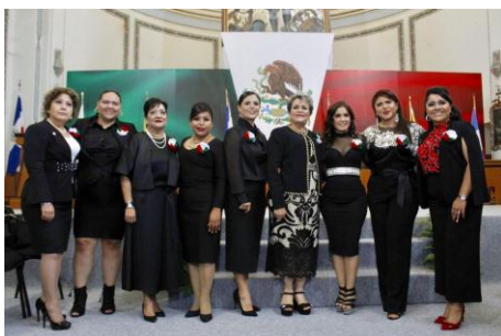
Sesión Solemne en la Conmemoración del 206 Aniversario de la Instalación del Primer Congreso de Anáhuac