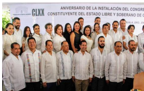
Sesión Solemne en Iguala de la Independencia a 170 años de la instalación de Primer Congreso Constituyente