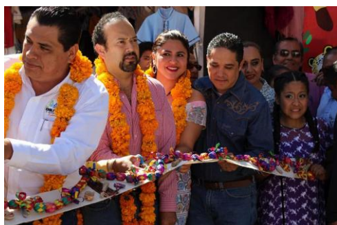
Feria de Navidad y Año Nuevo de Chilpancingo, Gro.