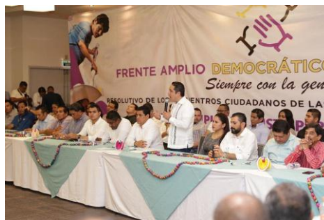
Reunión del FADG en Chilpancingo, Gro.