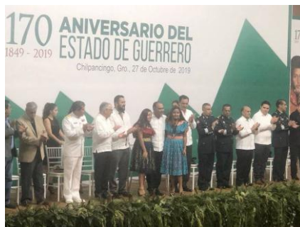
Asistencia en la entrega de Premios al Mérito Civil 2019.