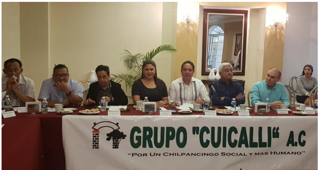
Reunión de Trabajo con el Grupo Cuicalli A. C.