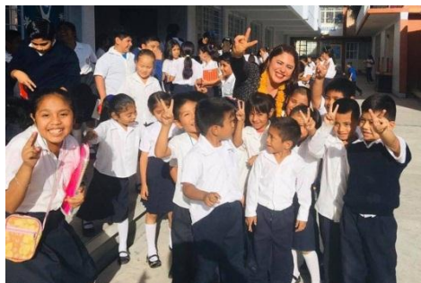
Donación de 4 computadoras a la Primaria Gral. Antonio A. Guerrero de Chilpancingo, Gro.