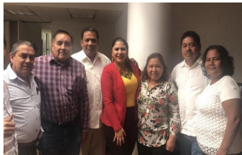
Reunión de Diputados Locales del PRD con la Dirigencia Estatal.