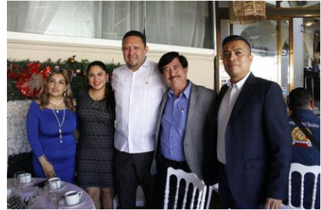
Posada de la Auditoría Superior del Estado de Guerrero