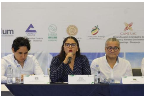
Reunión del Consejo de Cámaras Industriales y Empresariales de Guerrero con Legisladores locales