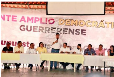
Reunión del FADG en Tixtla de Guerrero, Gro.