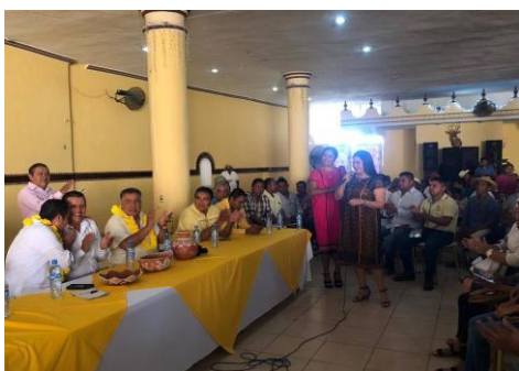
Reunión del Partido de la Revolución Democrática en Ometepec, Gro.