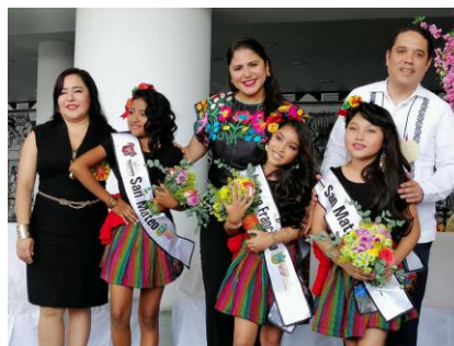
Concurso Flor de Nochebuena Infantil de Chilpancingo