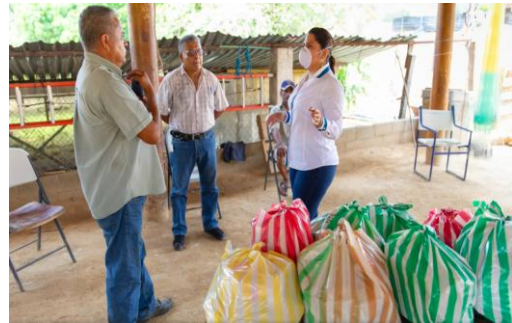
Reunión y entrega de apoyos alimentarios en Xaltianguis con la brigada ecologista