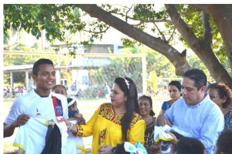
Donación de uniformes a los jóvenes del equipo Lobos Negros FC de la escuela de fútbol CEFFORMA.