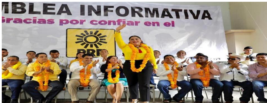
Integración del Frente Amplio Democrático Guerrerense, un bloque que concentra cien mil de los 180 mil afiliados al Partido de la Revolución Democrática