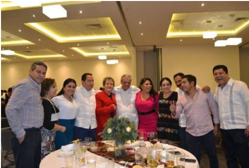
Cumpleaños ex gobernador Rubén Figueroa Alcocer.