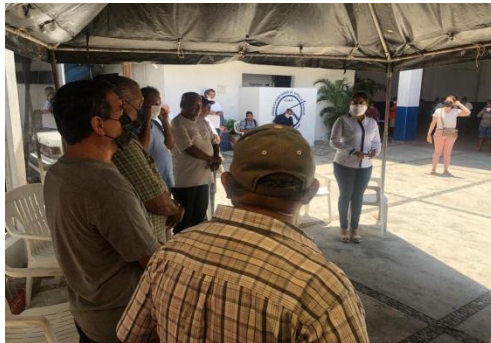
Entrega de apoyos alimentarios y sanitarios a transportistas y prestadores de servicios turísticos de Acapulco. .