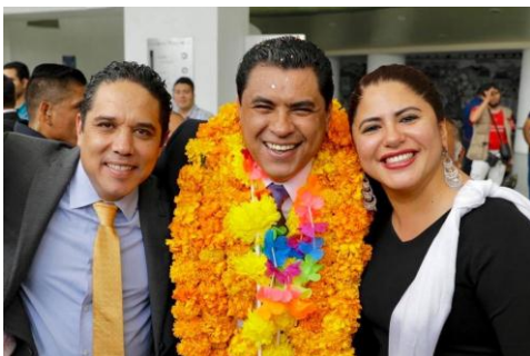
Primer Informe de Gobierno del Presidente Municipal de Chilpancingo, Gro., Antonio Gaspar