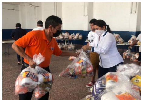
Entrega de apoyos alimentarios y sanitarios a diversos sectores en Acapulco.