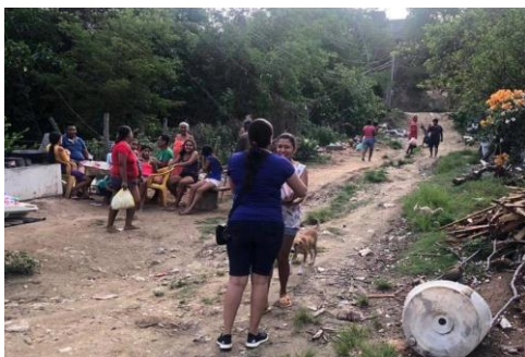
Entrega de apoyo alimentario en Tecpan de Galeana, Gro.