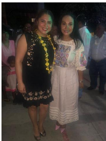
Primer Informe de Gobierno de la Presidenta Municipal de Copala, Gro., Guadalupe García Villalba