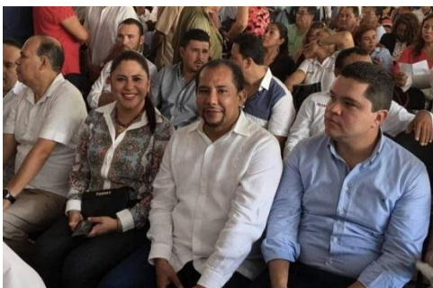
Presentación del Proyecto de Rescate del Parque "Papagayo" Acapulco, Gro.