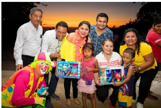
Obsequios a la niñez acapulqueña en el Día de Reyes