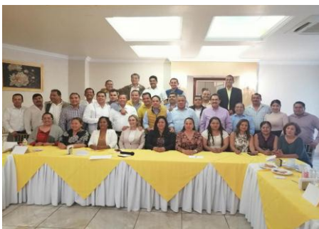
Reunión con la Dirigencia Nacional del Partido de la Revolución Democrática.