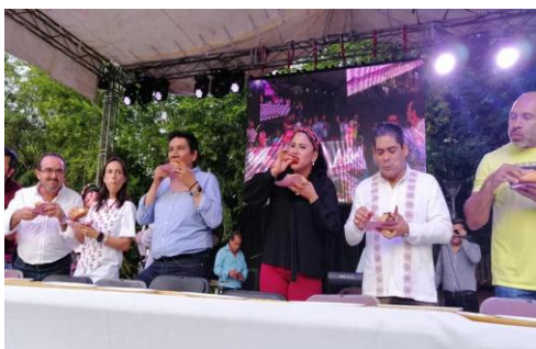
Primer Festival del Bolillo con Relleno en Técpan de Galeana, Gro.