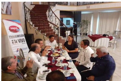
Entrevista con Digital 106.3 FM Radio.