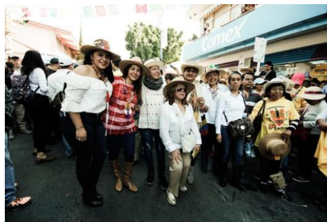
Tradicional Paseo del Pendón de Chilpancingo, Gro.