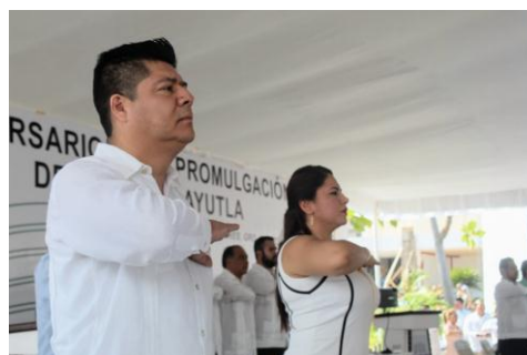
Sesión Solemne en la Conmemoración del 166 Aniversario de la Proclamación del Plan de Ayutla.