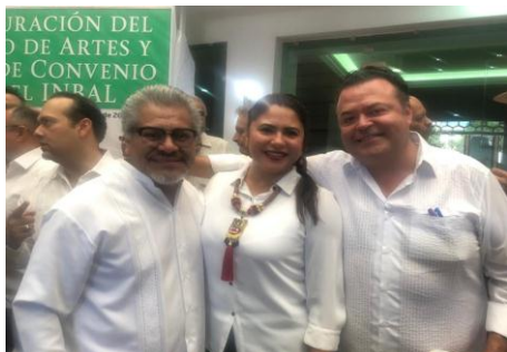
Inauguración del Centro de Artes y Firma de Convenio con el Instituto Nacional de Bellas Artes y Literatura