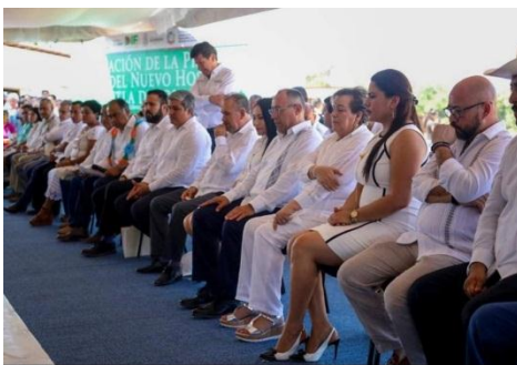
Inicio de la construcción del Hospital General de Ayutla de los Libres, Gro.