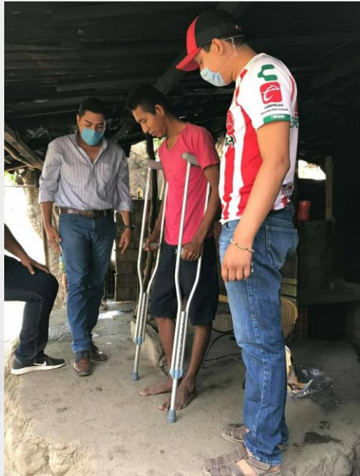
Apoyo con aparatos Ortopédicos