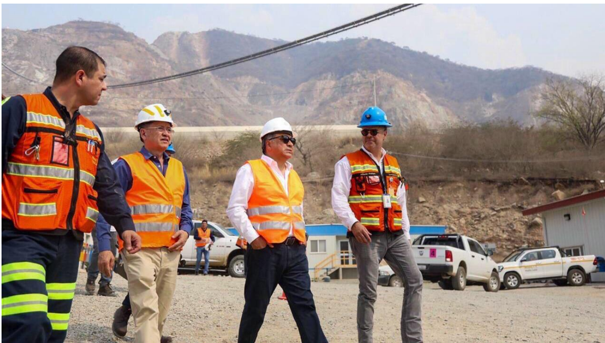
Visita a las instalaciones de la Mina Campo Morado, 17 de mayo de 2019