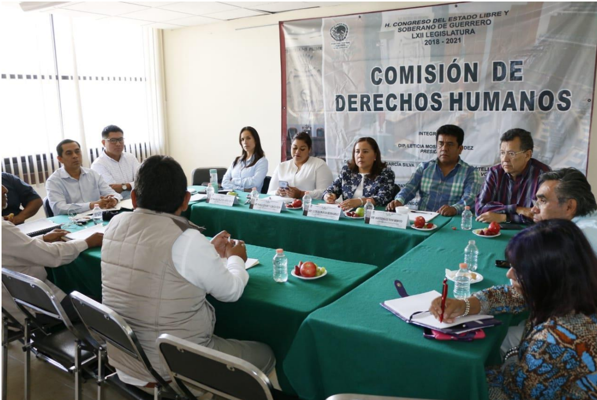
Reunión de la Comisión de Derechos Humanos, 12 de febrero de 2019.