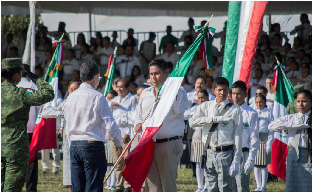
Commemoración del Día de la Bandera, Iguala de la Independencia, 24 de febrero de 2019.

El 27 de agosto del presente año, acudí con las y los integrantes de la Junta de Coordinación Política y de varias comisiones legislativas a la Cámara de Diputados, con el propósito de participar en la instalación de una Mesa de Trabajo para la Conmemoración del Bicentenario del Plan de Iguala.