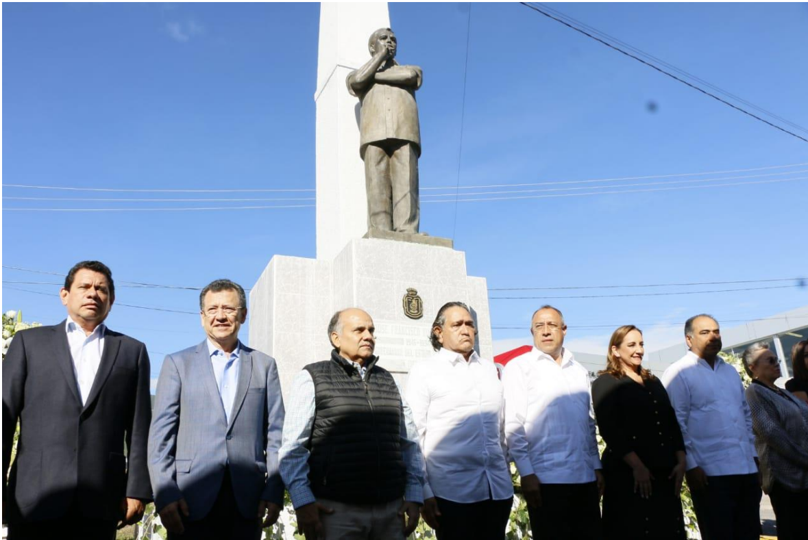
Asistí por igual a ceremonias cívicas como el homenaje luctuoso al ex gobernador José Francisco Ruiz Massieu, 28 de septiembre de 2018.