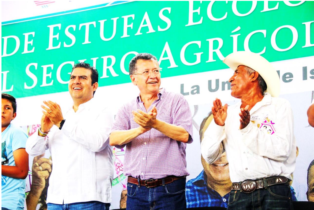
Gira de trabajo en el municipio de La Unión, 25 de agosto de 2019