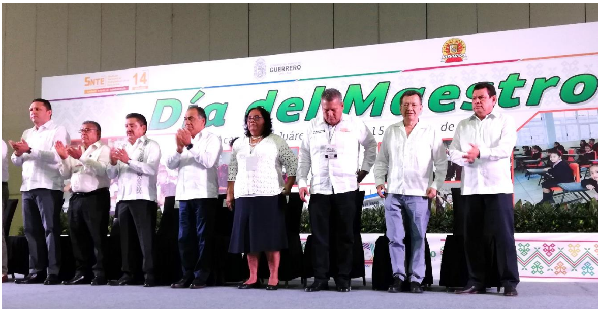
Conmemoración del Día del Maestro.