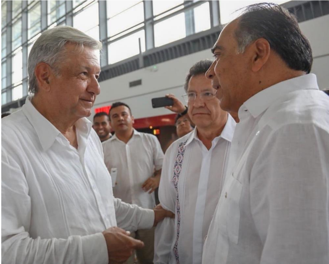
Visita del entonces presidente electo Andrés Manuel López Obrador, el 3 de octubre de 2018

Es por ello que he promovido una relación respetuosa y de suma de esfuerzos con el Poder Ejecutivo federal.