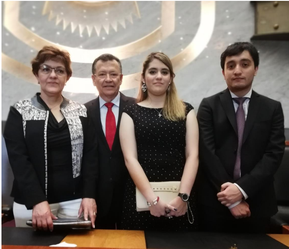
Mi familia: mi fuerza, mi inspiración.