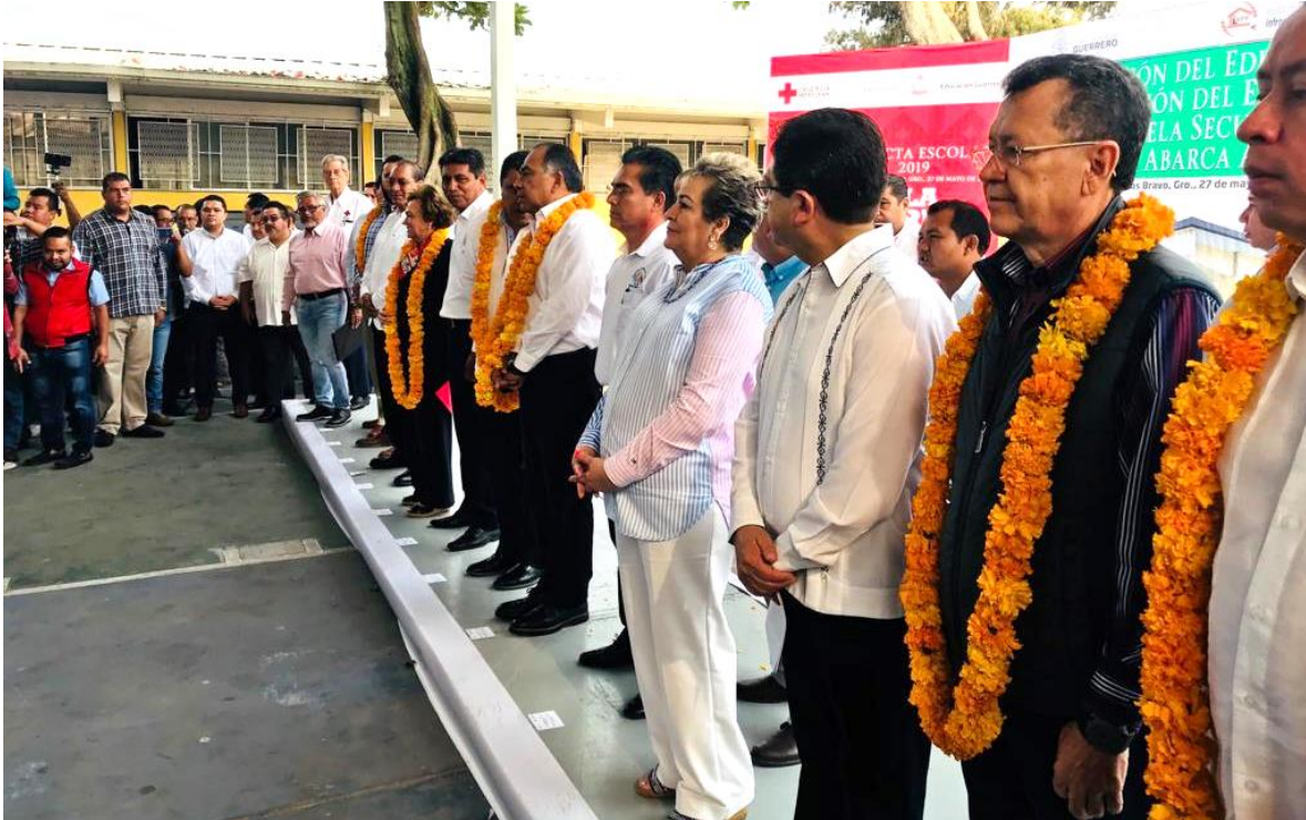
Inauguración de la secundaria Raymundo Abarca, en Chilpancingo.