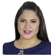
DIP. PERLA EDITH MARTÍNEZ RÍOS PRESIDENTA PRD